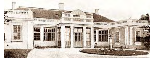
A család úrilaka, a Felső (Irinyi) utcán – ma iskola áll a helyén