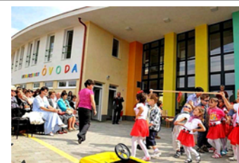
GYERMEKSZIGET ÖVODAAVATÓ 2010