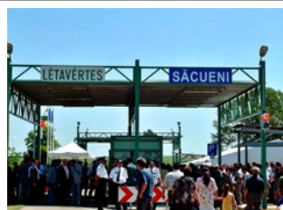
HATÁRÁTKELŐ MEGNYITÁSA 2004