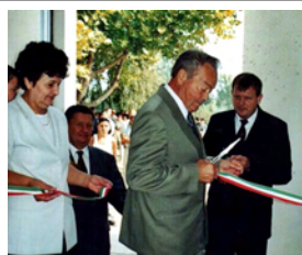
IRINYI ISKOLAÁVATÓ 2002