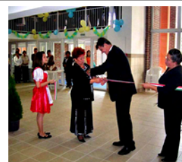
ARANY J. ISKOLAÁVATÓ 2006